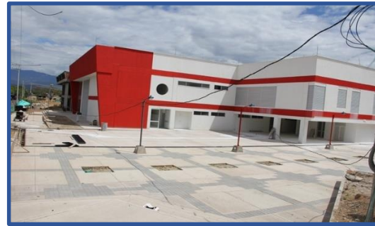
CAIMI Centro de Atención Integral Materno Infantil