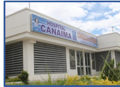
Hospital Comuna 6 CANAIMA