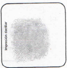
Ver nota 2 al respaldo

Declaro bajo juramento que la información contenida en el presente formulario es cierta y que las cesantías se utilizarán para la finalidad señalada (Ver nota 3)