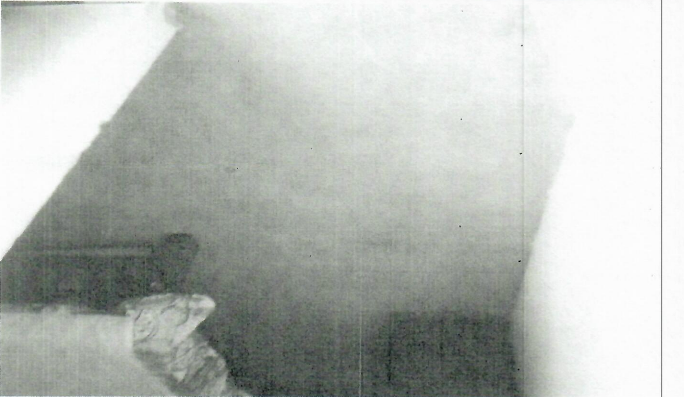
RENOVACION DE ALCOBAS, VIVIENDA UNIFAMILIAR DE LA CALLE 24ª SUR # 36-26, NEIVA HUILA. REGISTROS FOTOGRAFICOS ( ANTES DE LA OBRA)