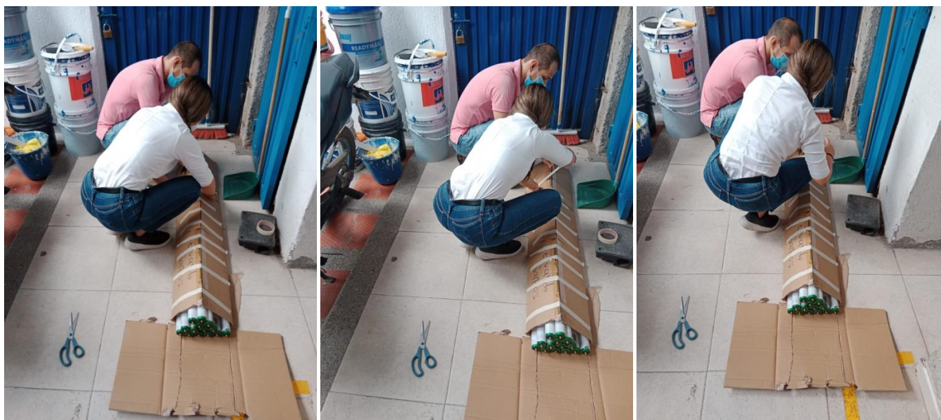
EMBALAJE Y RECOLECCIÓN DE LUMINARIAS SEDE EDUARDO SANTOS

El día 10 de marzo del 2022 el área de Gestión Ambiental junto con personal de mantenimiento realizo jornada recolección y embalaje de los residuos de Posconsumo de las sedes Eduardo Santos, Ipc, Granjas, Canaima y Palmas, estos residuos fueron llevados al punto de acopio central (Palmas) de la ESE CARMEN EMILIA OSPINA para posteriormente realizarles su adecuada disposición final.