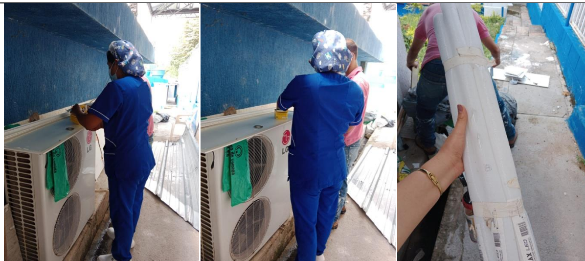
EMBALAJE Y RECOLECCIÓN DE LUMINARIAS SEDE IPC