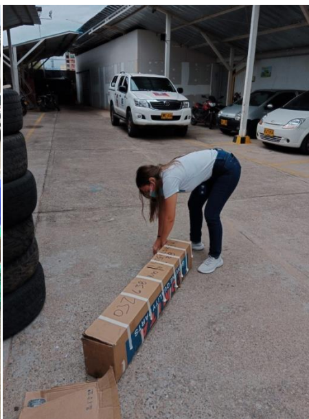
EMBALAJE DE LUMINARIAS