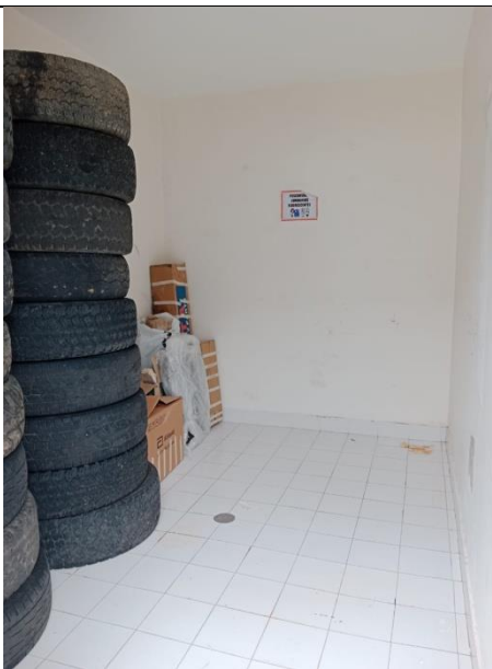
ALMACENAMIENTO TEMPORAL DESPUÉS