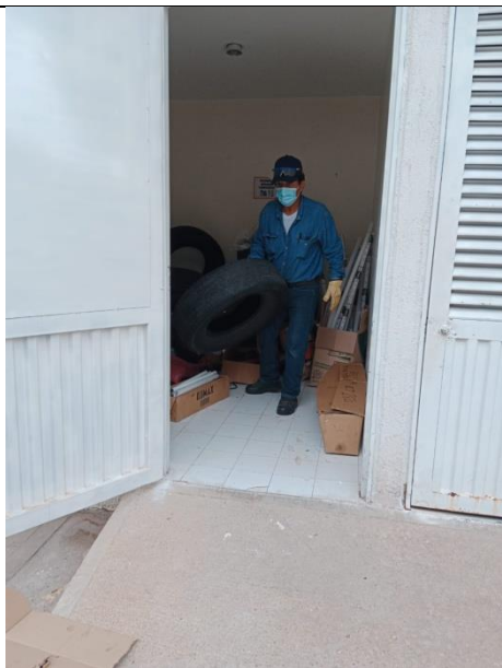
ALMACENAMIENTO TEMPORAL ANTES