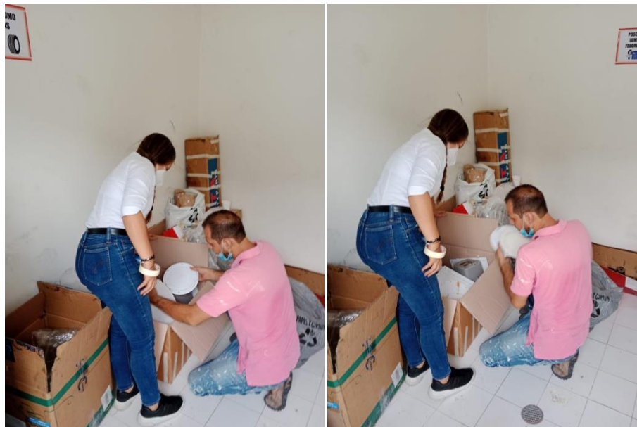
DISPOSICIÓN TEMPORAL DE LOS RESIDUOS POSCONSUMO EN PALMAS