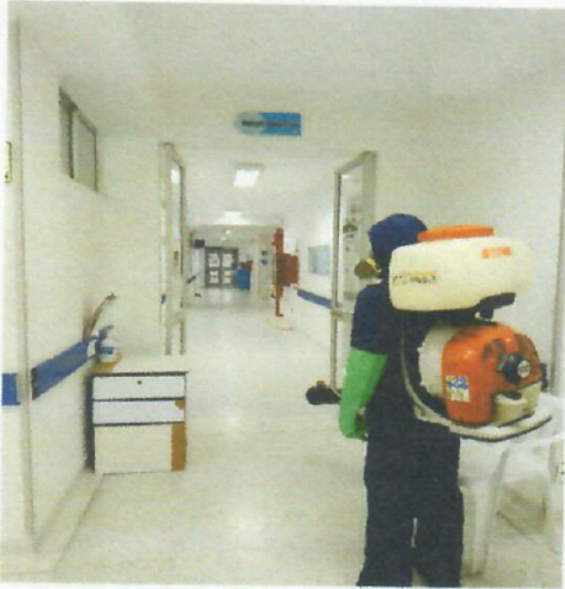
✚ Centro De Salud- Canaima AREA: Área De Hospitalización Fecha:12 de marzo de 2023

INFORME CORRESPONDIENTE AL PRIMER (01) CICLO DEL SERVICIO DE FUMIGACIÓN, DESRATIZACIÓN, CONTROL DE VECTORES, ÁCAROS Y TODA CLASE DE INSECTOS RASTREROS Y VOLADORES PARA LOS CENTROS DE SALUD DE LA E.S.E CARMEN EMILIA OSPINA