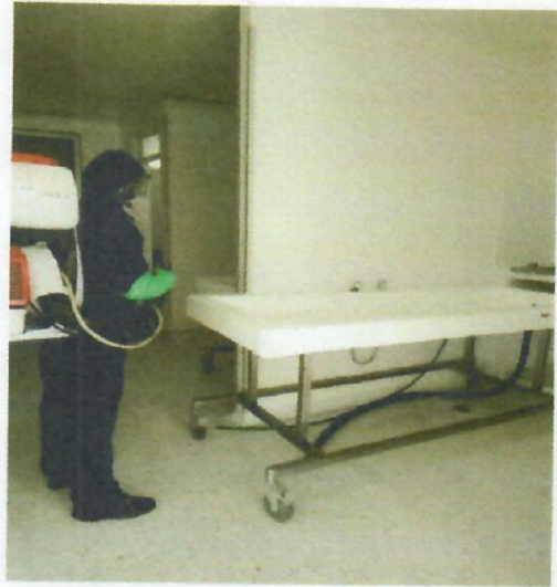
✚ Centro De Salud- Fortalecillas AREA: Todo El Centro De Salud Fecha:13 de marzo de 2023