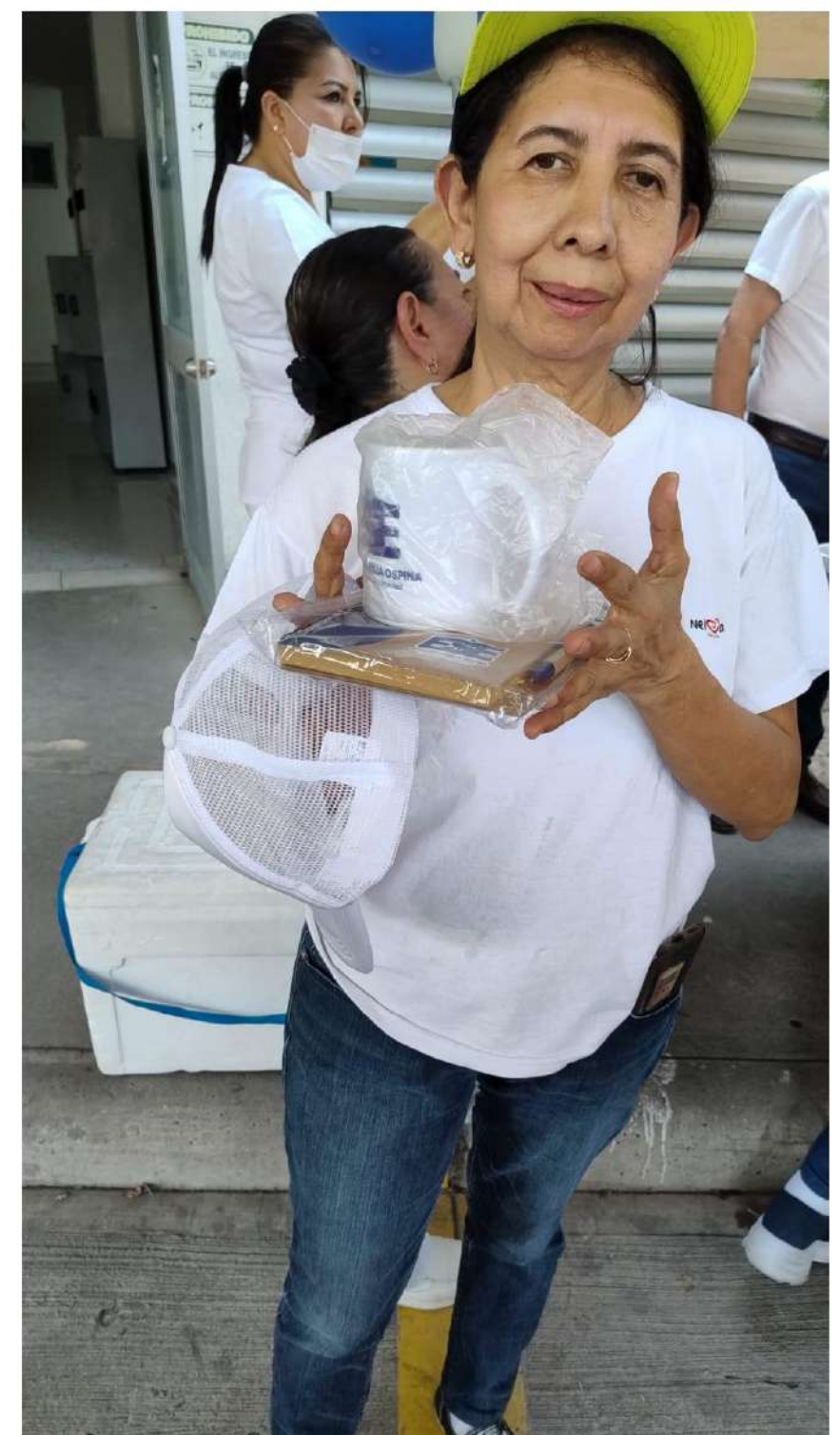
Actividad de estilos de vida saludable