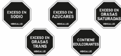
Imagen No. 4 Interpretación tabla nutricional